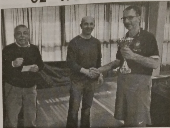
Nella foto il Vice sindaco premia il vincitore della gara Singolare Maschile 4 a N.C.